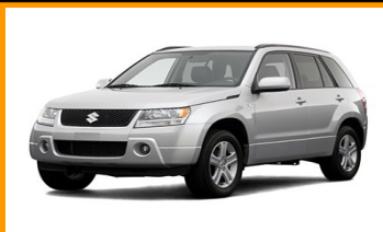
Grand Vitara JB (2005 -)