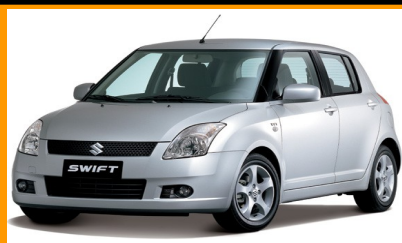
Swift (с 2011)