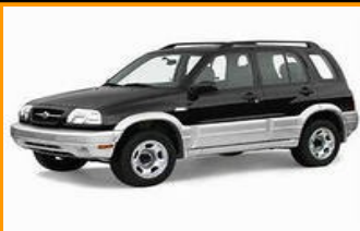
Grand Vitara SQ (-2005)