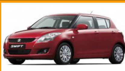
Swift (до 2011)