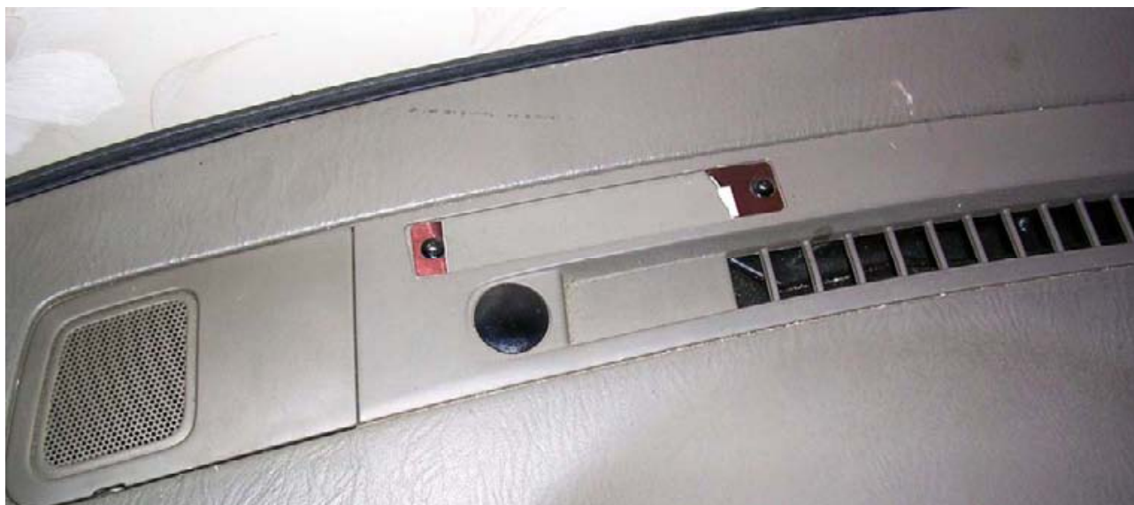
Фотография фрагмента торпедо со следами таблички с VIN кодом.

Если признать, что VIN код уничтожен, то придется сделать очевидный вывод о том, что владелец разборки заведомо хранил и продавал ворованные детали. Ведь он либо купил номерной агрегат с уничтоженным номером (заведомо ворованный), либо сам уничтожил этот номер, пытаясь скрыть следы преступления.