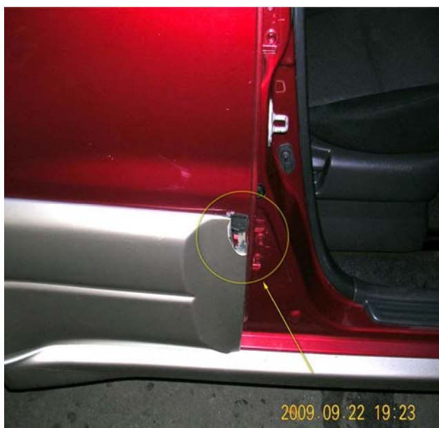
Фотография с места осмотра автомобиля