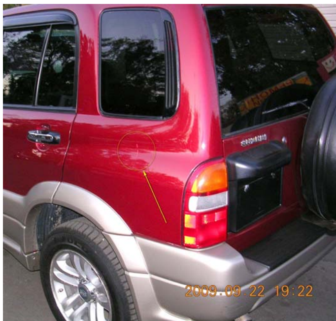
Фотография с места осмотра машины